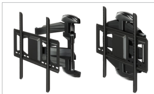
variabler Wandabstand 50 - 465 mm